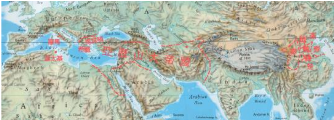
2. 前四世纪欧亚大陆的局势，其中部为亚历山大的希腊式帝国雄占。