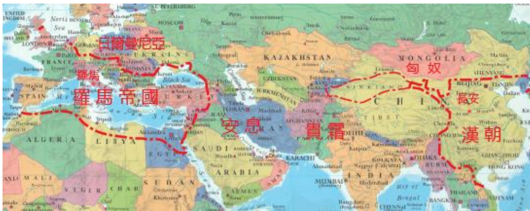
1. 公元一世纪时的东汉与罗马帝国，叠印在二十一世纪的政区图上。

二千年前，文明世界经历了第一个帝国时代。四大帝国横跨欧亚大陆与非洲北部，东端是大汉皇朝，西端是罗马帝国，中间隔着安息和贵霜。帝国维持安定，提高消费，引出贯穿大陆的长途通商，即后世所谓“ 丝路 ”。然则由于彼此相去甚远，而且有别的势力阻隔，汉朝与罗马并未直接建交。秦汉史或罗马史车载斗量，但比较两者则廖廖无几。